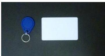
Fig. 3. Tags passivas utilizadas no projeto.

Neste sistema foram utilizadas tags passivas mostradas na Figura 3.