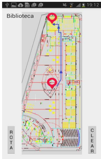
Fig. 7. Rota mostrando o caminho partindo rampa de acesso para a biblioteca.

O usuário pode obter rotas para um destino a partir de uma origem, no mapa é mostrado o melhor caminho a ser percorrido, ilustrado na Figura 7 e acessado através do botão Rota. Neste caso, foram considerados usuários que possuem deficiência física, que pode ser um cadeirante, portanto o percurso informado não possui escadas, degraus ou qualquer obstáculo que possa impedir sua locomoção. O botão CLEAR, da Figura 7, limpa a rota atual e volta para a tela inicial permitindo novas navegações.