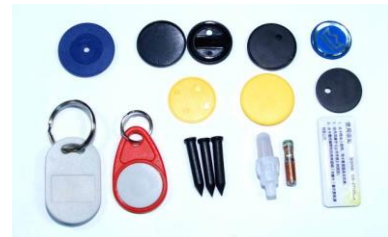
Fig. 1. Diferentes tipos de Tags NFC.

A figura abaixo mostra diversos tipos de Tags NFC.