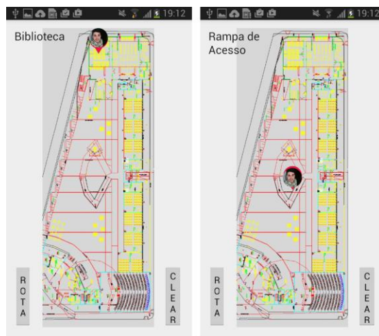
Fig. 6. Obtenção da localização quando no momento que o usuário estava (a) na biblioteca e depois (b) na rampa de acesso.

A Figura 6 mostra dois exemplos de exibição da localização do usuário: na biblioteca e na rampa de acesso.