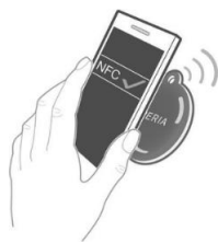
Fig. 2. Leitura de tag NFC a partir do celular.

A figura abaixo ilustra um smartphone fazendo a leitura de uma tag NFC.